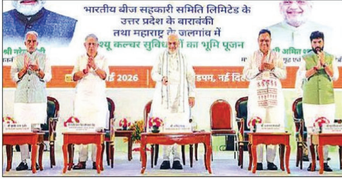
केंद्रीय सहकारिता मंत्री अमित शाह कई योजनाओं का शुभारंभ करते हुए

केंद्रीय मंत्री अमित शाह ने कहा कि जब केंद्रीय सहकारिता मंत्रालय का गठन किया जा रहा था, तब कई लोग इसका विरोध कर रहे थे। विरोधियों का कहना था कि सहकारिता मंत्रालय राज्य का विषय है। आज जब हमारा मंत्रालय पांच साल पूरा कर चुका है तो आज तक किसी भी विरोधी दल ने कोई विरोध नहीं किया। सहकारिता मंत्रालय ने यह साबित कर दिया है कि हम राज्य सरकार के काम में दखल देने के लिए नहीं, बल्कि उनकी मदद के लिए हैं।