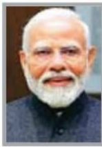
डॉ. मुखर्जी की जन्म जयंती नरेंद्र मोदी, प्रधानमंत्री

6 जुलाई का दिन राष्ट्रवाद और निस्वार्थ सेवा के आदर्शों में विश्वास रखने वाले करोड़ों देशवासियों के लिए बहुत ही विशेष है। आज हम डॉ. श्यामा प्रसाद मुखर्जी की 125वीं जन्म जयंती मना रहे हैं। उनका जीवन साहस और मां भारती के प्रति अटूट समर्पण का प्रेरणादायक उदाहरण है। डॉ. श्यामा प्रसाद मुखर्जी के व्यक्तित्व में विद्वता, जनसेवा और उच्च नैतिक मूल्यों का अद्भुत संगम था। आधुनिक भारत के कुछ ही नेताओं में इतने सारे गुण एक साथ देखने को मिलते हैं।