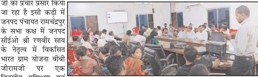
वीबी जीरामजी पर एक दिवसीय प्रशिक्षण एवं कार्यशाला आयोजित

प्रबंधन सहित विस्तृत जानकारी दी गई। इस दौरान विकसित ग्राम पंचायत को योजना कैसे बनाएँ और कार्यों की प्राथमिकता कैसे तय करें, इस पर विस्तार से चर्चा हुई। कार्य योजना के अनुसार ग्राम विकास हेतु कार्यों का प्रस्ताव भेजने की पूरी प्रक्रिया समझाई गई। श्रमिक हित के लिए समय पर रोजगार उपलब्ध न होने पर बेरोजगारी भत्ता तथा मजदूरी भुगतान में विलंब होने पर मुआवजा दिए जाने के प्रावधानों की जानकारी दी गई। कार्यशाला में सहायक प्रोग्रामर, वी.पी.आर.सी., समस्त तकनीकी सहायक, शाखा प्रभारी, सचिव एवं समस्त रोजगार सहायक उपस्थित रहे।