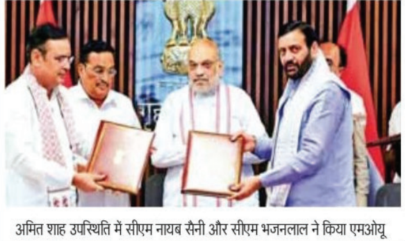
अमित शाह उपस्थिति में सीएम नायब सैनी और सीएम भजनलाल ने किया एमओयू

अमित शाह ने कहा कि यह समझौता प्रधानमंत्री मोदी द्वारा दिए गए सहकारी संघवाद के मंत्र का एक उत्कृष्ट उदाहरण है। साथ ही यह समझौता इस बात का भी उदाहरण है कि अगर राज्य सहकारी संघवाद की सोच को आगे बढ़ाएँ तो तीन दशक पुरानी समस्या भी सरलता से सुलझ सकती है।