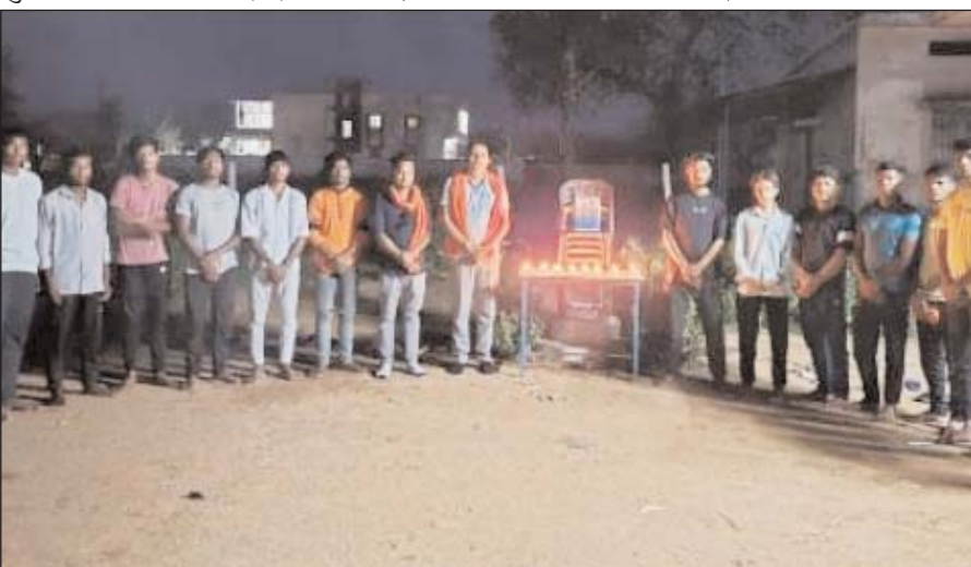
ऐतिहासिक और गौरवपूर्ण क्षण है, जो हमारे सुरक्षाबलों के साहस, समर्पण और बलिदान