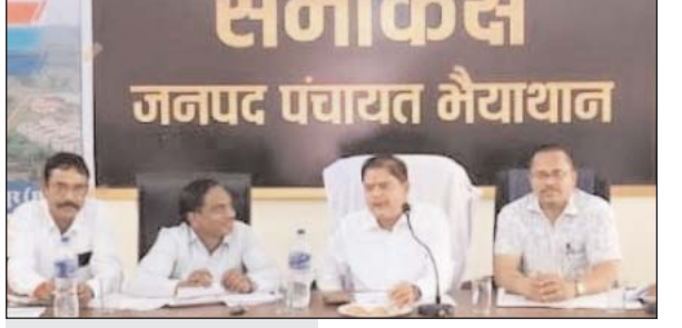
अपार आईडी, बायोमेट्रिक्स और स्कूल ग्रांट पर मिले कड़े निर्देश