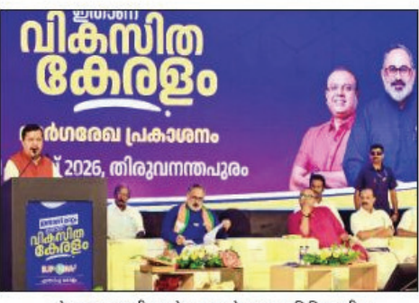
घोषणा पत्र जारी करते भाजपा के अध्यक्ष नितिन नबीन

भाजपा ने केरल चुनाव के लिए अपना घोषणापत्र जारी कर दिया है भाजपा का घोषणा पत्र पार्टी अध्यक्ष नितिन नबीन ने किया जारी