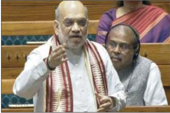
'जो हथियार उठाएगा वह कीमत चुकाएगा'

छ.ग.फ्रंटलाइन नई दिल्ली। लोकसभा में सोमवार को नक्सल मुक्त भारत पर अहम बहस हो रही है। केंद्र सरकार की ओर से नक्सलियों के खिलाफ सफल अभियान का पूरा खाका पेश किया जा रहा है। नक्सल मुक्त भारत बनाने की डेडलाइन 31 मार्च 2026 है। ऐसे में डेडलाइन से एक दिन पहले लोकसभा में इस अहम मुद्दे पर चर्चा हो रही है। केंद्रीय गृह मंत्री अमित शाह ने कहा कि कांग्रेस के समय आदिवासियों का विकास नहीं हुआ। पहले देश के 12 राज्य नक्सलवाद से प्रभावित थे और अब यह लगभग समाप्त हो गया है। गृह मंत्री अमित शाह ने कहा कि देश नक्सल मुक्त हो गया है। सुरक्षाबलों ने नक्सलियों के किले को तोड़ दिया है। दंडकारण्य में नक्सलियों की मुख्य कमेटी समाप्त हो गई है। उन्होंने नक्सलवाद के लिए पूर्व की कांग्रेस सरकार की नीतियों को भी दोषी ठहराया।