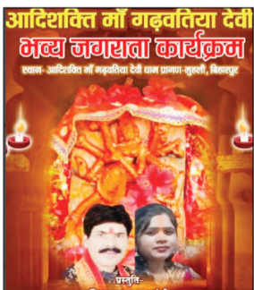
अवसर पर प्रसिद्ध भजन गायक पंडित लल्लू राज एवं उनकी

छ.ग. फ्रंटलाइन चांदनी बिहारपुर। क्षेत्र के महूली स्थित आदिशक्ति माँ गढ़वतिया देवी धाम में आज गुरुवार को भव्य जगराता कार्यक्रम का आयोजन किया गया है। इस आयोजन को लेकर पूरे क्षेत्र में भक्ति के साथ उत्साह का माहौल है। ग्रामीणों द्वारा व्यापक स्तर पर तैयारियां की जा रही हैं, जिससे यह आयोजन यादगार बन सके। धार्मिक आस्था के इस विशेष