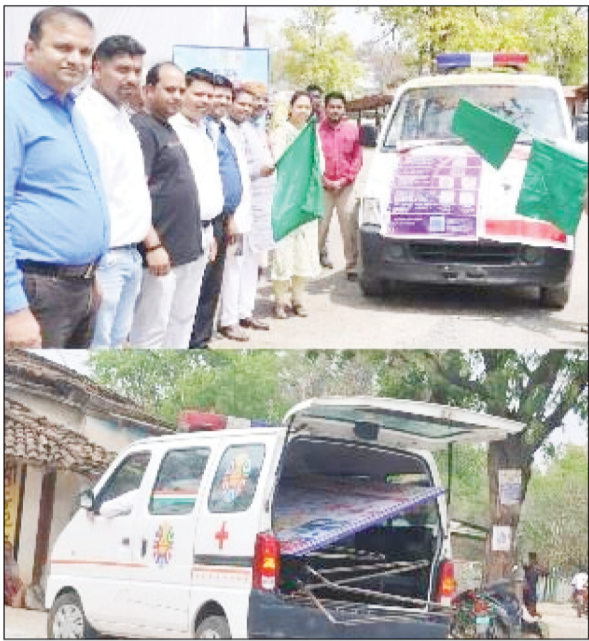
बनाने की बात कही गई। वहीं निक्षय वाहन को हरी झंडी दिखाकर रवाना किया गया और

छ.ग. फ्रंटलाइन बलरामपुर। शासन भले ही गरीबों के स्वास्थ्य के लिए योजनाओं की झड़ी लगा रहा हो और गांव-गांव तक एंबुलेंस जैसी सुविधाएं पहुंचाकर लोगों को समय पर इलाज कराने का दावा कर रहा हो, लेकिन जमीनी हकीकत कुछ और ही बयां कर रही है। जिम्मेदारों की लापरवाही अब खुलकर सामने आने लगी है, जिसने पूरे सिस्टम पर सवाल खड़े कर दिए हैं। मंगलवार को विश्व क्षय दिवस के अवसर पर 100 दिवसीय टीबी उन्मूलन अभियान के दूसरे चरण का भव्य शुभारंभ बलरामपुर के ऑडिटोरियम हॉल में किया गया। कार्यक्रम में बड़े-बड़े दावे किए गए, गांव-गांव जाकर जांच, समय पर उपचार और टीबी मुक्त जिला