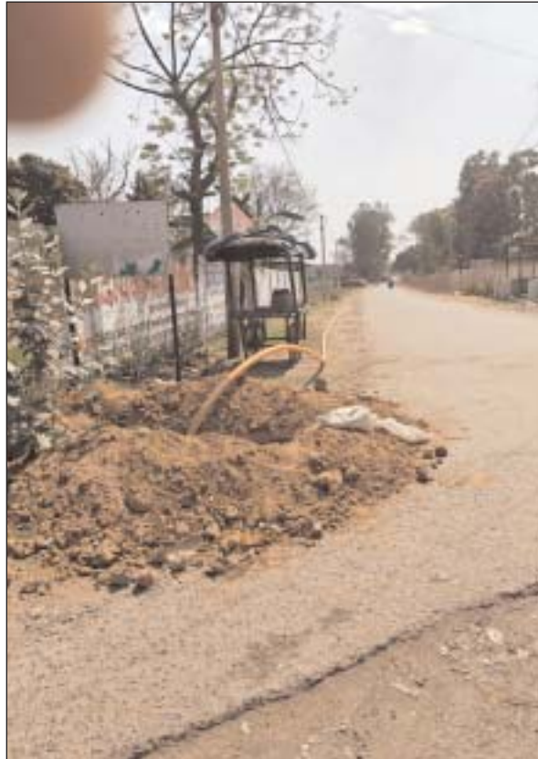
अलावा विद्युत विस्तार के नाम पर बिजली के खंभे भी बिना दीर्घकालिक योजना के खड़े कर दिए जा रहे हैं। लोगों का कहना है कि इन कार्यों में न तो विभागीय समन्वय नजर आता

छ.ग. फ्रंटलाइन बिश्रामपुर। क्षेत्र में राष्ट्रीय राजमार्ग क्रमांक 43 किनारे तथा ग्रामीण सड़कों के आसपास इन दिनों मनमाने ढंग से खुदाई कर पाइपलाइन और केबल बिछाने का कार्य जारी है। बिना समुचित योजना और संबंधित विभागों की अनुमति के हो रहे इन कार्यों ने न केवल वर्तमान में आवागमन को प्रभावित किया है, बल्कि भविष्य में सड़कों के विस्तार और चौड़ीकरण को लेकर भी गंभीर सवाल खड़े कर दिए हैं। जानकारी के अनुसार विभिन्न टेलीकॉम कंपनियों, गैस पाइपलाइन एजेंसियां तथा जल जीवन मिशन के तहत कार्यरत ठेकेदार अपने-अपने स्तर पर सड़क किनारे गड्ढे खोदकर पाइपलाइन और केबल बिछा रहे हैं। कई स्थानों पर तो बिना किसी पूर्व सूचना या सुरक्षा इंजायन के सड़क के किनारे लंबी-लंबी खुदाई कर दी जा रही है, जिससे दुर्घटना की आशंका भी बढ़ गई है। इसके