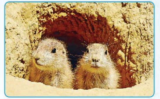
प्रेयरी डॉग्स जमीन के भीतर अंडरग्राउंड सिटी

बच्चों, नाम से कंप्यूटर मत होना! प्रेयरी डॉग्स असल में डॉगी नहीं, बल्कि गिलहरी परिवार के सदस्य हैं, जो जमीन के नीचे अद्भुत अंडरग्राउंड शहर बसाने के लिए जाने जाते हैं। उनकी इंजीनियरिंग इतनी सटीक होती है कि इसी शहरों का ड्रेनेज सिस्टम भी इसके सामने फेल हो जाए। इनके बनाए विशाल 'टाउन' केवल एक बिल नहीं, बल्कि हजारों मील में फैले भूमिगत शहर जैसे होते हैं। टेक्सास (अमेरिका) में एक बार 25,000 वर्ग मील में फैला इनका एक टाउन पाया गया था, जिसमें लगभग 40 करोड़ प्रेयरी डॉग्स रहते थे। ये शहर पौधों तक चलते हैं। इनके घर में अलग-अलग काम के लिए अलग-अलग कमरे होते हैं, जैसे- बच्चों के लिए 'नर्सरी', सोने के लिए 'बेडरूम', खाना रखने के लिए 'स्टोर रूम' और यहां तक कि कचरे के लिए अलग जगह होती है। प्रवेश द्वार के पास एक 'लिविंग पोस्ट' भी होता है, जहाँ से वे शिकारियों पर नजर रखते हैं। प्रेयरी डॉग्स अपने बिल के मुहानों को अलग-अलग ऊंचाई पर बनाते हैं। इससे दबाव में अंतर पैदा होता है, जिससे ताजी हवा अपने आप सुरंगों के अंदर घुमती रहती है। यह एक बेहतरीन वेंटिलेशन इंजीनियरिंग का उदाहरण है। ये बिल एक प्रवेश द्वार पर मिट्टी के ऊंचे टीले बनाते हैं। ये टीले न केवल इन्हें ऊंचाई से शिकारियों को देखने में मदद करते हैं, बल्कि बारिश के पानी को सुरंग के अंदर जाने से भी रोकते हैं। *