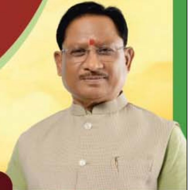
श्री विष्णु देव साय माननीय मुख्यमंत्री, छत्तीसगढ़

वर्चुअल मोड में राज्य के समस्त जिलों में शुभारंभ