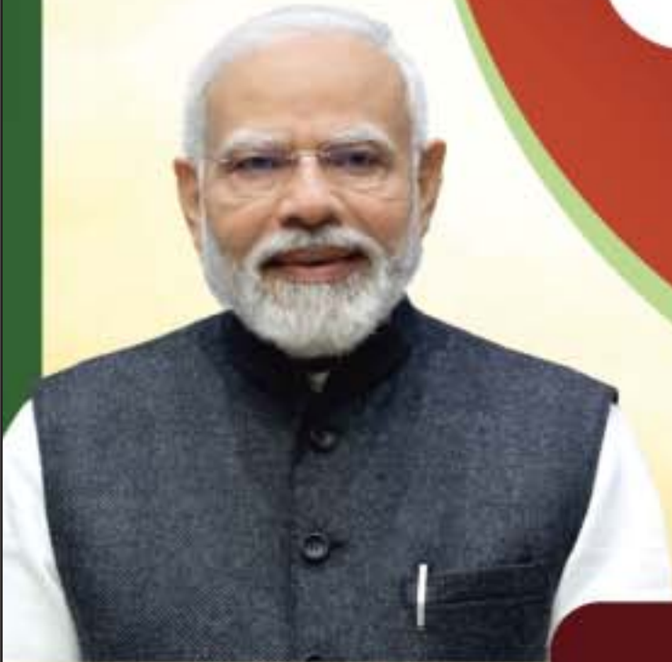
श्री नरेन्द्र मोदी माननीय प्रधानमंत्री

गौधाम लाखासार एवं गुरु घासीदास केन्द्रीय विश्वविद्यालय प्रेक्षागार, बिलासपुर (छ.ग.)