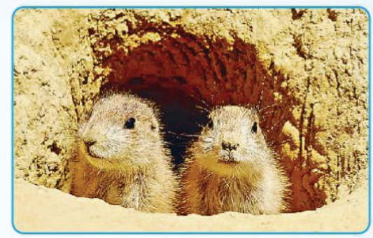
प्रेयरी डॉग्स जमीन के भीतर अंडरग्राउंड सिटी

बच्चों, नाम से कंप्यूज मत होना! प्रेयरी डॉग्स असल में डॉगी नहीं, बल्कि गिलहरी परिवार के सदस्य हैं, जो जमीन के नीचे अद्भुत अंडरग्राउंड शहर बसाने के लिए जाने जाते हैं। उनकी इंजीनियरिंग इतनी सटीक होती है कि इसी शहरों का ड्रेनेज सिस्टम भी इसके सामने फेल हो जाए। इनके बनाए विशाल 'टाउन' केवल एक बिल नहीं, बल्कि हजारों मील में फैले भूमिगत शहर जैसे होते हैं। टेक्सास (अमेरिका) में एक बार 25,000 वर्ग मील में फैला इनका एक टाउन पाया गया था, जिसमें लगभग 40 करोड़ प्रेयरी डॉग्स रहते थे। ये शहर पौधियों तक चलते हैं। इनके घर में अलग-अलग कमरे के लिए अलग-अलग कमरे होते हैं, जैसे- बच्चों के लिए 'नर्सरी', सोने के लिए 'बेडरूम', खाना रखने के लिए 'स्टोर रूम' और यहां तक कि कचरे के लिए अलग जगह होती है। प्रवेश द्वार के पास एक 'लिविंग पोस्ट' भी होता है, जहाँ से वे शिकारियों पर नजर रखते हैं। प्रेयरी डॉग्स अपने बिल के मुहानों को अलग-अलग ऊंचाई पर बनाते हैं। इससे दबाव में अंतर पैदा होता है, जिससे ताजी हवा अपने आप सुरंगों के अंदर घुमती रहती है। यह एक बेहतरीन वेंटिलेशन इंजीनियरिंग का उदाहरण है। ये बिल एक प्रवेश द्वार पर मिट्टी के ऊंचे टीले बनाते हैं। ये टीले न केवल इन्हें ऊंचाई से शिकारियों को देखने में मदद करते हैं, बल्कि बारिश के पानी को सुरंग के अंदर जाने से भी रोकते हैं। *