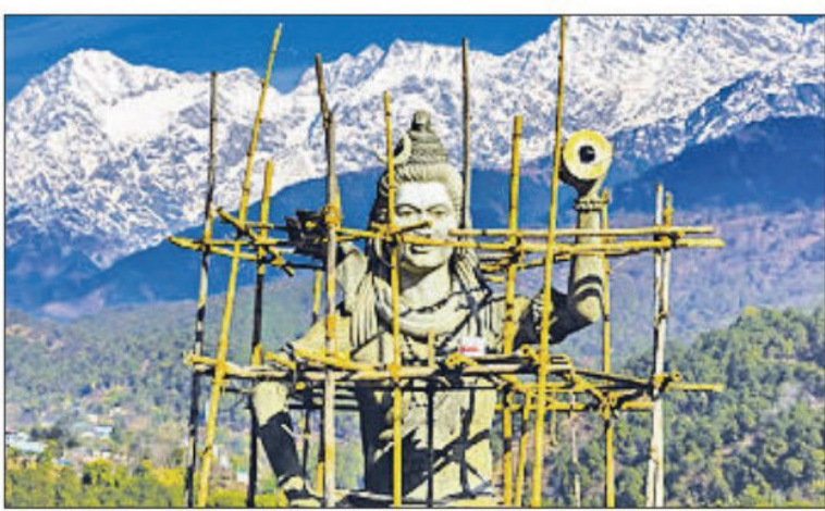
हिमाचल प्रदेश के पालम्पुर में सोमवार को खिटी घुम वाले में बोलधार रेज की कर्फ से ढकी चोटी पर भगवान शिव की बन रही मूर्ति।