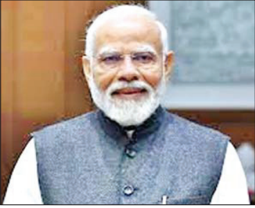
मोदी मलेशिया के प्रधानमंत्री अनवर इब्राहिम के

नयी दिल्ली। प्रधानमंत्री नरेन्द्र मोदी शनिवार से मलेशिया की दो-दिवसीय यात्रा पर जाएंगे, जिसका मकसद व्यापार, निवेश, ऊर्जा और समुद्री सुरक्षा के क्षेत्रों में द्विपक्षीय संबंधों को मजबूत करना है। विदेश मंत्रालय ने बुधवार को यह जानकारी दी। यह प्रधानमंत्री मोदी को मलेशिया की तीसरी यात्रा होगी, और अगस्त 2024 में भारत-मलेशिया द्विपक्षीय संबंधों को व्यापक रणनीतिक साझेदारी में बदलने के बाद यह उनकी पहली यात्रा होगी। विदेश मंत्रालय ने कहा कि इस यात्रा के दौरान