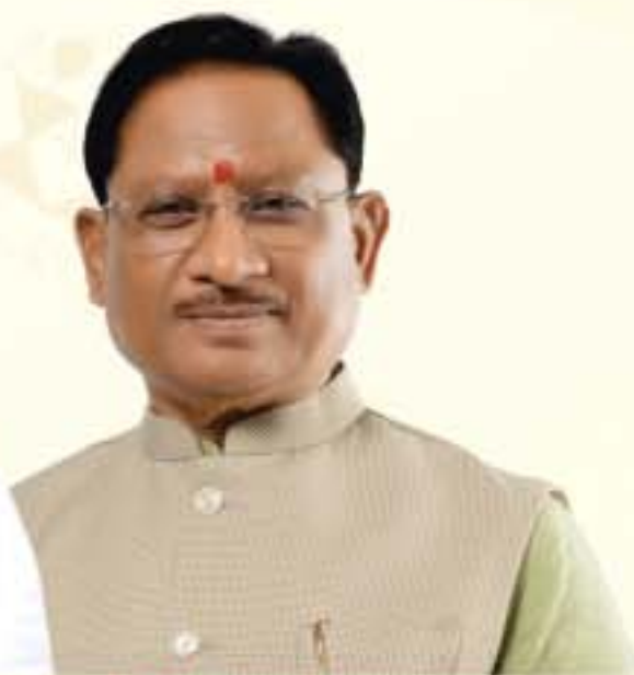
श्री विष्णु देव साय माननीय मुख्यमंत्री, छत्तीसगढ़

जीएसटी 2.0 लागू होने से कृषि उपकरण हुए सस्ते