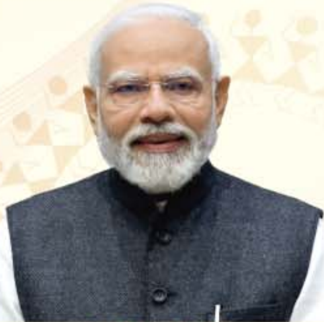
श्री नरेन्द्र मोदी माननीय प्रधानमंत्री