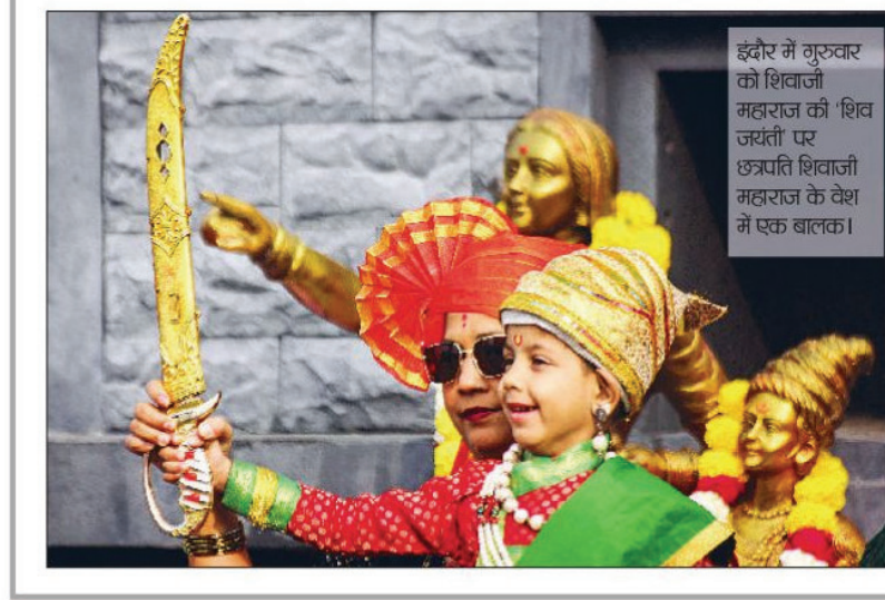
इंदौर में गुरुवार को शिवाजी महाराज की शिव जयंती पर उत्सवित शिवाजी महाराज के वेश में एक बालक।