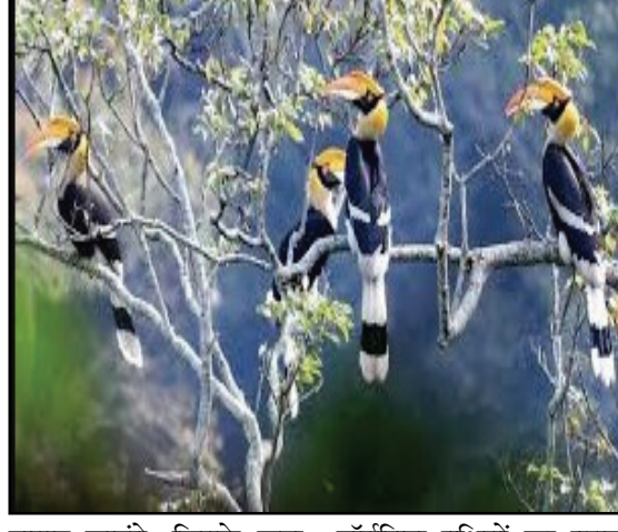
लगाए जाएंगे, जिनके फल हॉर्नबिल पक्षियों का प्रमुख