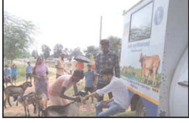
शिविरों के माध्यम से पशु उपचार, औषधि वितरण, कृमिनाशक दवा पान, डिडिफेंग, बधियाकरण, टीकाकरण एवं कृत्रिम गर्भाधान जैसी महत्वपूर्ण सेवाएँ दी जा रही हैं।

जिले के दूरस्थ एवं ग्रामीण अंचलों में पशुपालकों को पशु चिकित्सा सुविधाओं की सहज उपलब्धता सुनिश्चित करने के उद्देश्य से राज्य शासन द्वारा संचालित मोबाईल पशु चिकित्सा इकाई एक सशक्त माध्यम के रूप में उभरकर सामने आई है। यह पहल उन ग्रामों तक निःशुल्क, त्वरित एवं गुणवत्तापूर्ण पशु चिकित्सा सेवाएँ पहुँचा रही है, जहाँ तक पूर्व में पशु चिकित्सा सुविधाओं की पहुँच सीमित थी। लेकिन अब पशुओं के बेहतर स्वास्थ्य, दुग्ध उत्पादन क्षमता में वृद्धि तथा पशुपालकों की आय सुदृढ़ करने की दिशा अच्छी पहल साबित हो रही है।