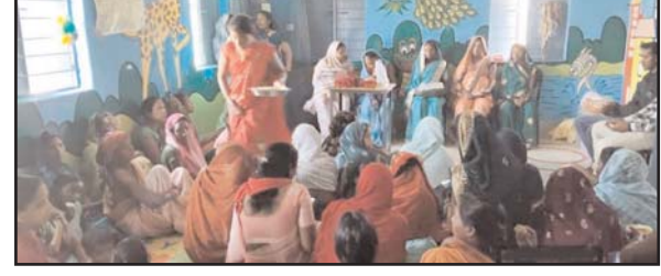
योजनाओं का लाभ लेने की अपील की। कार्यक्रम का उद्देश्य समुदाय स्तर पर पोषण के प्रति जागरूकता बढ़ाना एवं सुपोषित समाज की दिशा में ठोस कदम उठाना रहा।

स्वच्छता एवं टीकाकरण के विषय में आवश्यक जानकारी दी गई। जिला पंचायत अध्यक्ष ने कहा कि माँ और बच्चे का स्वास्थ्य समाज की मजबूत नींव है, इसके लिए पोषण संबंधी योजनाओं का लाभ लेने की अपील की। कार्यक्रम का उद्देश्य समुदाय स्तर पर पोषण के प्रति जागरूकता बढ़ाना एवं सुपोषित समाज की दिशा में ठोस कदम उठाना रहा।