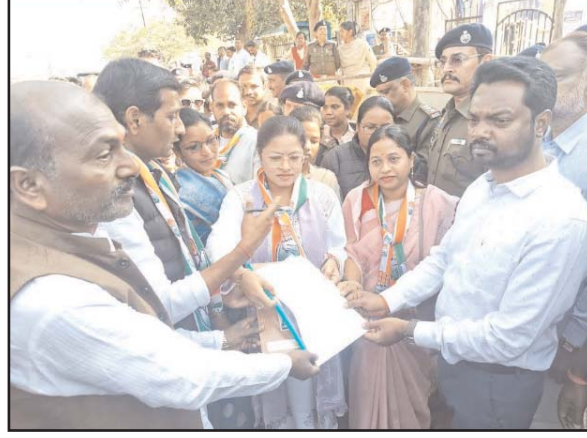
मे बनाया गया था, उससे राष्ट्रपिता महात्मा गांधी का नाम हटाने एवं इस कानून को कमजोर करने की कोशिश केन्द्र की मोदी सरकार कर रही है। मनरेगा के माध्यम से देश के सैकड़ों परिवारों को रोजगार उपलब्ध होता था परन्तु केन्द्र सरकार लगातार रोजगार की इस गारंटी को खत्म करने का प्रयास कर रही है। वहीं