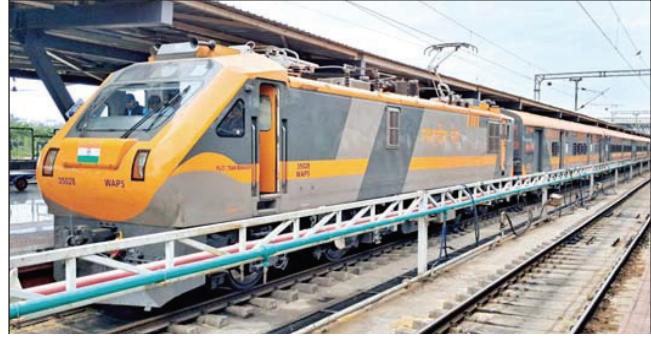
लखनऊ जंक्शन से सीतापुर होकर चलेंगी डबलडेकर और काठगोदाम एक्सप्रेस