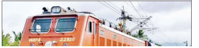
स्टेशन तक इंतजार नहीं करेंगे। यात्री के न आने पर टीटीई चेकिंग के समय ही अपने ईएफटी पर उस सीट पर गेट टन अप (यात्री के बोर्डिंग स्टेशन पर आने की सूचना) दर्ज कर देगा। खाली सीट की सूचना अंकित होते ही ट्रेन में वॉटिंग या आरएसपी टिकट पर चल रहे यात्रियों को वह सीट आवंटित हो जाएगी।

लखनऊ। ट्रेन की बोर्डिंग को लेकर जल्द ही एक बड़ा बदलाव होने जा रहा है। टीटीई यात्रियों का निर्धारित बोर्डिंग से अगले