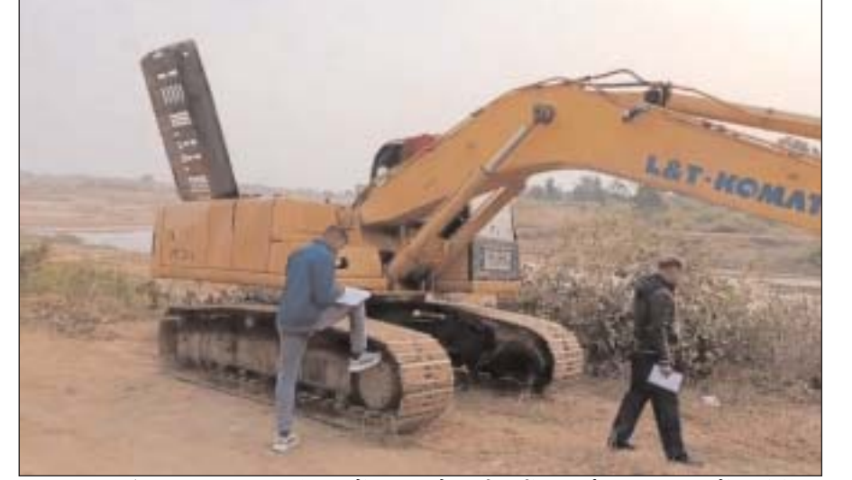
छ.ग.फ्रंटलाइन मनेन्द्रगढ़ (एमसीबी)।