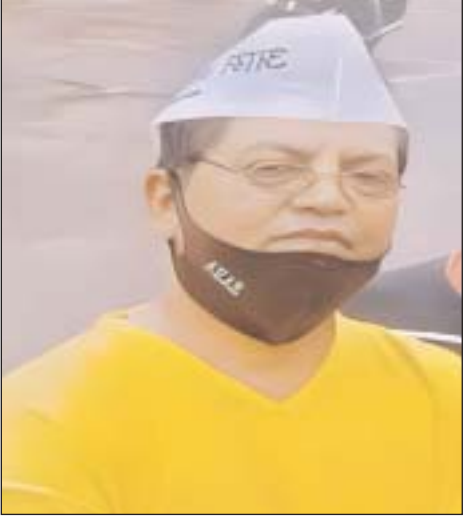
अराजकता, अंदरूनी गुटबाजी, तानाशाही रवैये और आम