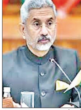
मॉडिया मंच एक्स पर एक पोस्ट में कहा, आज वाशिंगटन डीसी में किटिकल मिनरल्स मिनिस्टीरियल सम्मेलन को संबोधित किया। अत्यधिक संकेंद्रण से जुड़ी चुनौतियों

न्यूयॉर्क। विदेश मंत्री एस. जयशंकर ने महत्वपूर्ण खनिजों का कुछ ही जगहों पर अत्यधिक संकेंद्रण होने से संबंधित चुनौतियों का उल्लेख करते हुए बुधवार को कहा कि अंतरराष्ट्रीय सहयोग के माध्यम से आपूर्ति श्रृंखलाओं के समर्थक जोखिम को कम करना जरूरी है।