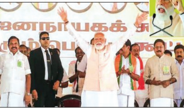
जनसभा को संबोधित करते प्रधानमंत्री मोदी

अब बदलाव आएगा पीएम मोदी ने कहा कि दशकों तक एलडीएफ और यूडीएफ ने शहर को उपेक्षा की और शहर को बुनियादी सुविधाओं से वंचित रखा। ये जरूरतों को पूरा करने में नाकाम रहे हैं। अब यहां भाजपा का बदलाव दिखेगा।