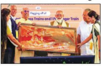
प्रधानमंत्री तिरुवनंतपुरम में विकास परियोजनाओं के शुभारंभ, ट्रेन सेवओं को हरी झंडी के दौरान

निशान दक्षिण, केरल में भाजपा का चुनावी शंखनाद