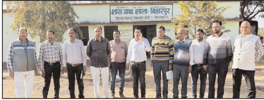
प्रथमिक, 14 माध्यमिक, 1 पीएम श्री तथा 3 हाई व हायर सेकेंडरी विद्यालय शामिल हैं। निरीक्षण के दौरान अधिकारियों ने विद्यालयों में शिक्षक एवं

कड़ाई से पालन करने, विद्यार्थियों के शैक्षणिक स्तर को बेहतर बनाने एवं वार्षिक परीक्षा परिणामों में सुधार लाने पर विशेष चर्चा की गई। अधिकारियों ने स्पष्ट कहा कि सभी शिक्षक एवं संकुल प्रभारी पूरी निष्ठा और मेहनत से कार्य करें, ताकि विकासखंड का शैक्षणिक परिणाम जिले में उत्कृष्ट रहे। लक्ष्य तय करते हुए कहा गया कि आने वाले समय में बिहारपुर विकासखंड को शिक्षा के क्षेत्र में एक आदर्श ब्लॉक के रूप में स्थापित किया जाए। शिक्षा विभाग द्वारा किए गए इस सघन निरीक्षण से विद्यालयों में अनुशासन, जवाबदेही एवं गुणवत्ता सुधार की उम्मीद जताई जा रही है।