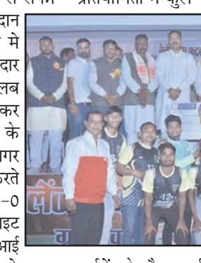
दरुमैंट के दौरान कई रोमांचकारी मुकाबला देखने की मिले जिससे ग्रामीण और शहरी क्षेत्र की उभरी खेल प्रतिभाओं को अपनी क्षमता दिखाने का सशक्त मंच मिला। समापन समारोह में विजेता टीम कोल्ड्स क्लब देवनगर को 31 हजार नगद राशि व ट्राफी तथा उपविजेता टीम ब्राइट स्टार क्लब

ब्राइट स्टार की टीम टिक नहीं सकी। मैदान में बड़ी संख्या में दर्शकों की मौजूदगी रही और खिलाड़ियों के उत्साहवर्धन में तालियां गूंजती रही। संभाग स्तरीय इस फुटबॉल प्रतियोगिता में कुल 16 टीमों ने भाग लिया।