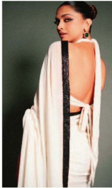
साड़ी या लहंगे के साथ पहनने वाले बैकलेस ब्लाउज पर बनवा सकती हैं।

साड़ी में स्टाइलिश दिखने के लिए ब्लाउज के डिजाइन को बांडी टाइप और आउटफिट के कलर कॉम्बिनेशन को ध्यान में रखकर चुनना बेहद जरूरी होता है। आजकल मार्केट में कई वैरायटी में आपको ब्लाउज के लेटेस्ट डिजाइंस नजर आ जाएंगे, लेकिन स्टाइलिश और बॉल्ड दिखने के लिए हम बैकलेस ब्लाउज पहनना काफी पसंद करते हैं। बदलते दौर में आजकल बैकलेस ब्लाउज के भी कई डिजाइंस आपको इन्टरनेट के जरिये देखने को मिल जाएंगे। बैकलेस ब्लाउज को आप सिंपल या बिना स्टाइल किए नहीं छोड़ सकती हैं। तो चलिए आज हम आपको बताने वाले हैं बैकलेस ब्लाउज को स्टाइलिश लुक देने के आसान टिप्स और बताएंगे इनसे जुड़ी अहम बातें जो आपके लुक में जान डालने का काम कर सकती हैं।