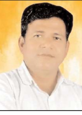
ब्लॉक कांग्रेस ने कलेक्टर को सौंपा ज्ञापन