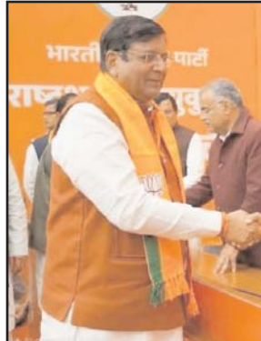
मैं संगठन को मजबूती प्रदान करने में नितिन नवीन जी का योगदान अविस्मरणीय रहा है। उनकी कुशल नेतृत्व क्षमता, संगठनात्मक दूरदर्शिता और मेहनत से न केवल छत्तीसगढ़