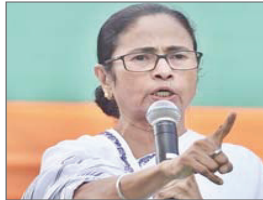
कोलकाता। परिचम बंगाल विधानसभा में विपक्ष के नेता शुभेंदु अधिकारी ने मुख्यमंत्री ममता बनर्जी द्वारा राज्य में मतदाता सूची के विशेष गहन पुनरीक्षण (एसआईआर) को लेकर लगाए गए आरोपों को निराधार बताया। उन्होंने मुख्यमंत्री पर राजनीतिक कारणां से एसआईआर प्रक्रिया को पट्टी से उतारने का आरोप लगाया। अधिकारी ने एक्स पर एक पोस्ट में यह भी कहा कि उन्होंने मुख्य निर्वाचन आयुक्त ज्ञानेश कुमार को पत्र लिखा है और दावा किया कि एसआईआर से मतदाता सूचियों में

एजेंसी। नगपुर। महाराष्ट्र निकाय चुनाव प्रचार में व्यस्त ऑल इंडिया मर्जलिस-ए-इतेहादुल मुस्लिमीन (एआईएमआईएम) के प्रमुख अमरुद्दीन ओवैसी का हिजाब पहने बेटी का एक दिन देश का प्रधानमंत्री बनने वाले बयान पर सियासत शुरू हो चुकी है। ओवैसी ने असम के मुख्यमंत्री हिमंत बिस्वा सरमा पर तीखा हमला बोला है। ओवैसी का यह बयान असम सीएम की टिप्पण के बाद आया, जिसमें उन्होंने कहा था कि भारत एक हिंदू राष्ट्र होने के नाते एक हिंदू व्यक्ति को ही देश का प्रधानमंत्री बनते हुए देखेंगा। नागपुर में ओवैसी ने असम सीएम पर कारा तंज कसते हुए कहा कि उनके दिमाग में 'ट्यूबलाइट' है।