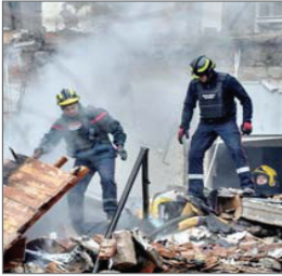
विद्यालय को नुकसान पहुंचा है। उन्होंने यह भी बताया कि वायु रक्षा प्रणालियों ने वॉरेनेज़ के उमर 17 ड्रोन मार गिराए। यह शहर लगभग 10 लाख से अधिक आबादी वाला है और यूक्रेन सीमा से करीब 250 किलोमीटर दूर स्थित है।