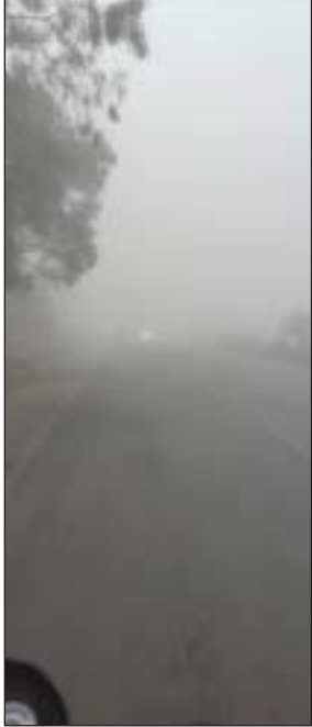
सरगुजा संभाग में एक बार फिर ढंड की जोरदार वापसी के कारण लोग दिन में भी ठिठुरने को मजबूर हो गए हैं। 24 घंटे के अंदर न्यूनतम तापमान में उल्लेखनीय गिरावट आने से शनिवार की रात का न्यूनतम तापमान जहां 9.9 डिग्री था। वहीं रविवार की रात को पारा 5 डिग्री से गिरकर 4.8 डिग्री तक पहुंच गया है। शुष्क हवाओं के साथ घने कोहरे ने जनजीवन अस्त-व्यस्त कर दिया है। सोमवार की सुबह घने कोहरे के कारण क्षैतिज दृश्यता 10-20 मीटर तक सिमट गई थी। इन सबके बीच सोमवार की सुबह नर्सरी से 8वीं तक के बच्चे घने कोहरे व शीतलहर के बीच कंपकंपाते हुए स्कूल जाते दिखे। ढंड से बच्चों के स्वास्थ्य पर प्रभाव पड़ना लाजिमी है। चिकित्सक ने भी ढंड से बचने की सलाह दी है।

ठिठुरती ढंड में नर्सरी से 8वीं तक के बच्चे कंपकंपाते स्कूल की ओर रुख किए