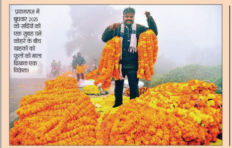
प्रयागराज में बुधवार 2025 को सर्दियों की एक सुबह घने कोहरे के बीच वाहकों को फूलों की माला दिखाता एक विक्रेता।