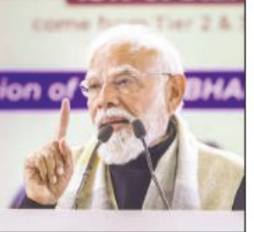
एजेसी नई दिल्ली

प्रधानमंत्री ने कहा- इसकी नींव विज्ञान भवन में रखी थी