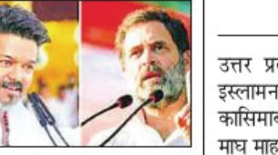
राहुल गांधी और विजय

अप्रैल-मई में होने वाले 5 विधानसभा चुनावों को लेकर कांग्रेस आलाकमान ने बैठकों का सिलसिला शुरू कर दिया है। शनिवार शाम राहुल गांधी और खरोगे तमिलनाडु कांग्रेस के वरिष्ठ नेताओं के साथ अहम बैठक करेंगे। उम्मीद है कि तमिलनाडु को लेकर कांग्रेस की भावी रणनीति को लेकर जगरी सस्पेंस खत्म हो सकता है।