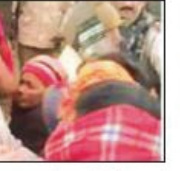
अरोप है कि लाठीचार्ज में कई ग्रामीण घायल हो गए, जिन्हें उपचार के लिए सामुदायिक स्वास्थ्य केंद्र में भर्ती कराया गया है। कल दूसरे समुदाय के लोगों ने प्रभात फेरी को रोकने का प्रयास किया था।

उत्तर प्रदेश के बदायूं जिले के इस्लामनगर थाना क्षेत्र के ग्राम ब्योर कासिमाबाद में शुक्रवार की भोर माघ माह में निकाली जा रही प्रभात फेरी को पुलिस ने विवादित रास्ता बताते हुए रोक दिया। जबकि यह प्रभात फेरी पिछले 50 वर्षों से इसी रास्ते से निकलते आ रही है। बात इतनी बढ़ गई कि झलात बेकाबू होते देख पुलिस ने लाठीचार्ज कर दिया।