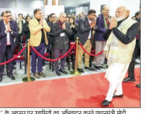
'नेशनल स्टार्टअप डे' के अवसर पर उद्यमियों का अभिवादन करते प्रधानमंत्री मोदी

इसका समूह देश के उज्वल भविष्य को बता रहा