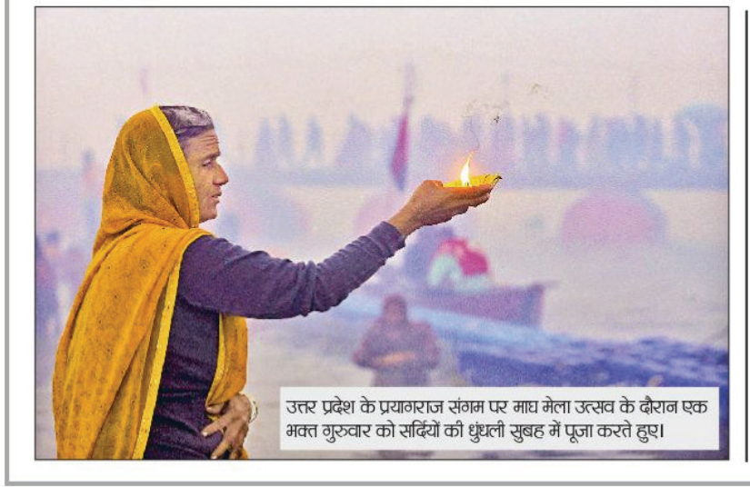
उत्तर प्रदेश के प्रयागराज संगम पर माघ मेला उत्सव के दौरान एक भक्त गुजुवर को सखियों की धुंधली सुबह में पूजा करते हुए।