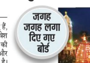
श्रीगंगा सभा के सदस्य

हर की पैड़ी पर जगह-जगह बोर्ड लगा दिए गए हैं, जिसमें स्पष्ट लिख दिया गया कि अहिंदू का प्रवेश पूरी तरह निषेध है। इसके अलावा तीर्थस्थल की मर्यादा को ध्यान में रखते हुए हरकी पैड़ी और मालवीय द्वीप क्षेत्र में ड्रोन उड़ान प्रतिबंधित है। किसी भी प्रकार के फिल्मी गानों पर फिल्म और रील बनाना भी पूर्णतः वर्जित है। श्रीगंगा सभा ने इस प्रकार से रील्स आदि सोशल मीडिया पर वायरल करने पर कानूनी कार्यवाही की चेतावनी दी है। कुछ दिन पहले हरकी पैड़ी क्षेत्र में बनाया गया एक वीडियो भी सोशल मीडिया पर वायरल होने के बाद हंगामा हो गया था। वीडियो में दो युवक अरबी वेशभूषा में घाटों पर घूमते नजर आ रहे थे। इसके बाद तीर्थ पुरोहितों ने नागजगी जताई है। मामले का पुलिस ने सज्जन लेते हुए जांच शुरू की।