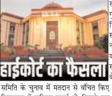
हाईकोर्ट का फैसला