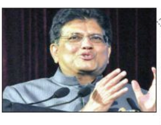
एजेसी नई दिल्ली

मंत्री गायल ने उद्यमियों को बताया देश में 2 लाख स्टार्टअप रजिस्टर्ड 21 लाख से ज्यादा रोजगार दिए