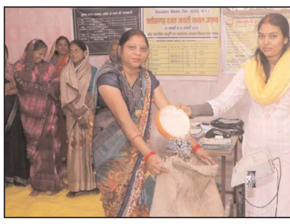
उत्सव के दौरान ग्राम संबलपुर, लटोरी में गैस कनेक्शन का वितरण किया गया। रजत जयंती चावल उत्सव के माध्यम से शासन की जनकल्याणकारी योजनाओं को जानकारी आम नागरिकों तक पहुंचाने और सार्वजनिक वितरण प्रणाली को अधिक सुदृढ़ बनाने का प्रयास किया जा रहा है।

अंतर्गत उपभोक्ता जागरूकता सप्ताह मनाया जा रहा है, जिसमें उपभोक्ता अधिकारों, उत्पाद खरीदी के समय सावधानियों, अपमिश्रण एवं नकली वस्तुओं से संबंधित जानकारी दी जा रही है। साथ ही हैंडबिल, पोस्टर एवं पम्पलेट का निःशुल्क वितरण किया जा रहा है। उत्सव के दौरान ग्राम संबलपुर, लटोरी में गैस कनेक्शन का वितरण किया गया। रजत जयंती चावल उत्सव के माध्यम से शासन की जनकल्याणकारी योजनाओं को जानकारी आम नागरिकों तक पहुंचाने और सार्वजनिक वितरण प्रणाली को अधिक सुदृढ़ बनाने का प्रयास किया जा रहा है।