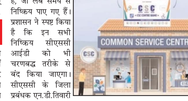
जिले में संचालित सीएससी द्वारा निर्धारित मानकों की अवहेलना किए जाने पर सीएससी मुख्यालय, जिले के 5 सौ निष्क्रिय आईडी पर गिरेगी गाज

अनिवार्य है। बैनर एवं सूची को निर्धारित प्रारूप में फ्रेम कराकर लगाना होगा, जिसमें स्टेट लोगो एवं सीएससी का नाम स्पष्ट रूप से अंकित हो। सभी वीएलई के लिए पुलिस सत्यापन प्रमाण पत्र जमा करना अनिवार्य किया गया है। साथ ही सभी लेन-देन प्रतिदिन सीएससी पोर्टल के माध्यम से ही किए जाने के निर्देश दिए गए हैं। जिन कॉमन सर्विस सेंटर की आईडी बंद की गई है, उन्हें आवश्यक सुधार कर सभी मानकों को पूर्ण करने के बाद जिला प्रबंधक से संपर्क करने का निर्देश दिया गया है।