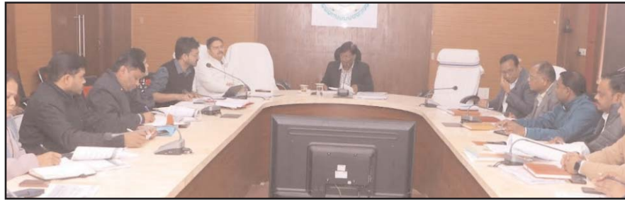
कलेक्टर ने महिला एवं बाल विकास विभाग तथा स्वास्थ्य विभाग की संयुक्त समीक्षा बैठक आयोजित की। बैठक में जिले में संचालित पोषण एवं स्वास्थ्य कार्यक्रमों की प्रगति की विस्तार से समीक्षा करते हुए अधिकारियों को प्रभावी क्रियान्वयन के निर्देश दिए गए।

बैठक में बताया गया कि हार्ड रिस्क प्रेग्नेंसी वाली महिलाओं को स्वास्थ्य विभाग द्वारा टूल किट उपलब्ध कराई जा रही है। इन्हें विशेष रूप से चिन्हित कर उनके घरों पर विशेष चिन्ह बनाकर पहचान की जा रही है, ताकि उन्हें प्राथमिकता के साथ स्वास्थ्य सेवाओं का लाभ दिलाया जा सके।