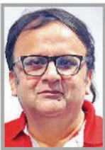
विश्लेषण विवेक शुक्ला

बिहार विधानसभा चुनाव के दौरान, राहुल गांधी ने राजद नेता तेजस्वी यादव को अकेला छोड़कर विदेश दौरा किया और मुख्यमंत्री पद के उम्मीदवार के रूप में उनके नाम की घोषणा में हस्तक्षेप किया। यह घटनाक्रम इतना गंभीर हुआ कि झारखंड की राजनीति में भी कांग्रेस को बाहर करने की बातें होने लगी थीं। राहुल गांधी की राजनीति की पहचान हमेशा जिद पर अड़े रहने की रही है। यह कोई अचरज की बात नहीं है कि उनके द्वारा उठाए गए मुद्दे संसद में भी उखाड़-फेंके गए। खासकर केंद्रीय गृह मंत्री अमित शाह ने संसद में कांग्रेस के चुनावी इतिहास को तर्कपूर्ण तरीके से खंडित किया। उन्होंने जवाहरलाल नेहरू से लेकर इंदिरा गांधी तक के चुनावी कदमचाल को सामने रखा। अमित शाह ने स्पष्ट रूप से यह बताया कि आजादी के बाद, प्रधानमंत्री के चुनाव के लिए मतदान हुआ था, तो सरदार पटेल के पक्ष में 28 वोट आए थे, जबकि नेहरू को केवल 2 वोट मिले थे, फिर भी नेहरू को प्रधानमंत्री बना दिया गया। शाह ने इसे स्वतंत्र भारत में लोकतंत्र का पहला अपमान बताया। यह कांग्रेस के लिए एक शर्मनाक स्थिति थी और इस पर पार्टी कोई ठोस जवाब नहीं दे पाई। राहुल गांधी की रणनीति के बजाय, अब कांग्रेस का पूरा ध्यान यह आरोप लगाने पर केंद्रित हो गया है कि उनको पार्टी के खिलाफ चुनावी घोषणापत्र ही नहीं है। उनके पास तथ्यों और तर्कों का स्पष्ट अभाव है। यह उस पार्टी का दुर्भाग्य है, जिसका नेतृत्व यह मानने को तैयार नहीं कि उनकी पिछली गलतियों से कुछ सीखा जाए। राहुल गांधी की राजनीतिक शैली अब उस मुकाम पर पहुंच चुकी है, जहां चुनावी हार को ही अनुचित कारा देना और सच्चाई को नकारना उनकी दिनचर्या बन चुकी है। राहुल गांधी ने लगातार प्रधानमंत्री मोदी पर 'वोट चोर' का आरोप