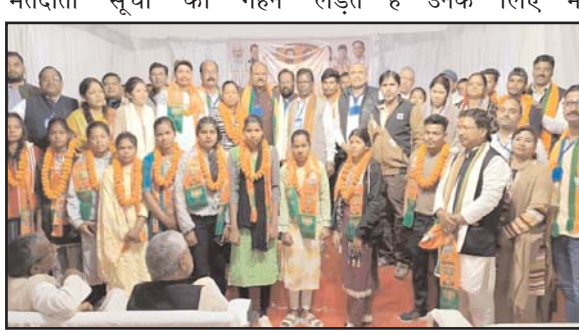
रामानुजनगर मंगल भवन में हुआ आयोजन