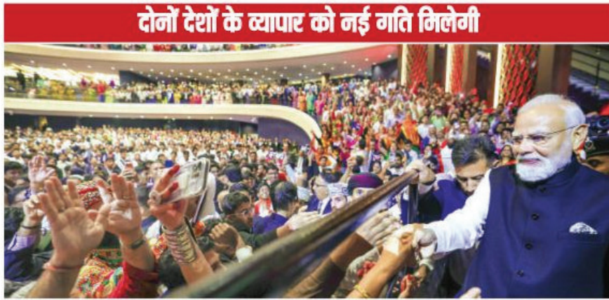
पीएम मोदी ने ओमान की राजधानी मस्कट में भारतीय समुदाय के लोगों से मुलाकात की।

दिवाली का दीया हमारे घर को ही नहीं, पूरी दुनिया को रोशन करेगा