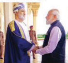
व्यापारिक मंच पर पीएम नरेंद्र मोदी ने की मुलाकात