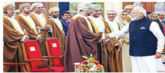
व्यापारिक मंच पर पीएम नरेंद्र मोदी ने की मुलाकात