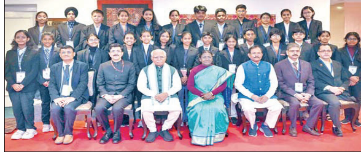
राष्ट्रपति मुर्मू ने दो साल की बच्ची से दुकर्म और हत्या के दोषी की दया याचिका खारिज की

नयी दिल्ली। राष्ट्रपति द्रौपदी मुर्मू ने रविवार को कहा कि देश के सभी क्षेत्रों में ऊर्जा दक्षता लाने के लिए हर नागरिक में व्यवहारिक परिवर्तन बेहद जरूरी है। राष्ट्रपति ने राष्ट्रीय ऊर्जा संरक्षण दिवस के कार्यक्रम को संबोधित करते हुए कहा कि प्रकृति के साथ संतुलित जीवन शैली अपनाने की चेतना भारत की सांस्कृतिक परंपरा का मूल है। यही विचार लाइफस्टाइल फॉर एन्वायरनमेंट लाइफ के माध्यम से पूरी दुनिया तक पहुंचाया जा रहा है। उन्होंने कहा भारत के ऊर्जा परिवर्तन की सफलता के लिए हर क्षेत्र और हर नागरिक की भागीदारी आवश्यक है। सभी क्षेत्रों में ऊर्जा दक्षता लाने के लिए व्यवहार में बदलाव बेहद जरूरी है।