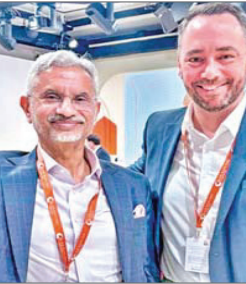
लतविया की विदेश मंत्री बैबा ब्रेज़ के साथ मिलाकर बहुत अच्छा लगा। मंत्री संयुक्त अरब अमिरात की राजधानी अबू धाबी में तीन दिवसीय सर बानी यास फोरम 2025 में भाग लेने पहुंचे थे। सम्मेलन रविवार को समाप्त हुआ। जयशंकर ने शिखर सम्मेलन के दौरान ब्रिटेन के उप प्रधानमंत्री डेविड लेमी से भी मुलाकात की।

दुबई। विदेश मंत्री एस. जयशंकर ने संयुक्त अरब अमिरात (यूएई) में उच्च-स्तरीय अंतरराष्ट्रीय शिखर सम्मेलन से इतर यूरोप, ब्रिटेन और मिश्र के अपने समकक्षों से मुलाकात की। कई महत्वपूर्ण भूराजनीतिक और सुरक्षा संबंधी चुनौतियों पर चर्चा के लिए विश्व के नेता और नीति निर्माता यूएई में एकजुट हुए हैं। जयशंकर ने शनिवार को सोशल मीडिया पर एक पोस्ट में कहा कि लखजमबर्ग के उप प्रधानमंत्री और विदेश मंत्री जेवियर बेटेल, पोलैंड के उप प्रधानमंत्री और विदेश मंत्री रादोस्लव सिकोर्सकी और