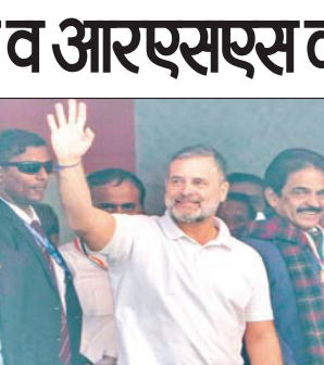
आरएसएस की है। हमारी विचारधारा, हिंदुत्वान की विचारधारा, हिंदु धर्म की विचारधारा और दुनिया के सभी धर्मों की विचारधारा कहती है कि सत्य सबसे जरूरी है। भागवत कहते हैं कि सत्य का कोई मतलब नहीं है, सत्ता जरूरी है। उन्होंने कहा, सत्य और असत्य के बीच लड़ाई है। हम सत्य के साथ खड़े होकर हिंदुत्वान से नरेंद्र मोदी, अमित शाह तथा आरएसएस सरकार को हिंदुत्वान से हटाएंगे।

नयी दिल्ली। कांग्रेस के पूर्व अध्यक्ष राहुल गांधी ने कथित वोट चोरी को लेकर रविवार को प्रधानमंत्री नरेंद्र मोदी, भारतीय जनता पार्टी तथा निर्वाचन आयोग पर कड़ा हमला बोला और कहा कि उनकी पार्टी सत्य के साथ खड़े होकर प्रधानमंत्री मोदी और आरएसएस को सरकार को देश की सत्ता से हटाएगी। राहुल ने यहाँ रामलैला मैदान में कांग्रेस की वोट चोरी, गूढ़ छोड़े रैली को संबोधित करते हुए दावा भी किया कि प्रधानमंत्री नरेंद्र मोदी का आत्मविश्वास खत्म हो गया क्योंकि उन्हें पता चल गया है कि उनकी वोट चोरी पकड़ी गई है। उन्होंने यह आरोप फिर दोहराया कि निर्वाचन आयोग भारतीय जनता पार्टी (भाजपा) के साथ मिलकर काम कर रहा है। राहुल गांधी ने राष्ट्रीय स्वयंसेवक संघ (आरएसएस) के प्रमुख मोहन भागवत के एक बयान का हवाला देते हुए कहा भागवत ने कहा कि विश्व सत्य को नहीं शक्ति को देखा है, जिसके पास शक्ति है उसे माना जाता है। यह विचारधारा