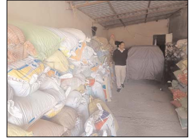
पोस्टों पर भी टीमों की तैनाती की गई है। निगरानी दल द्वारा रात्रिकालीन गश्त के साथ-साथ सदिग्ध वाहनों की सघन जांच की जा रही है। सदिग्ध कोचियों एवं बिचौलियों के प्रक्रिया की निगरानी के लिए इंटीग्रेटेड कमांड एंड कंट्रोल सेंटर की स्थापना की गई है, जिससे खरीदी, भंडारण एवं परिवहन की रियल टाइम मॉनिटरिंग सुनिश्चित हो सकेगी।

वाहनों एवं परिवहन माध्यम से अवैध रूप से धान गतिविधियों पर विशेष नजर खपाने की घटनाओं पर रोक रखी जा रही है। आंतरिक चेक लगाने तथा धान खरीदी की पूरी