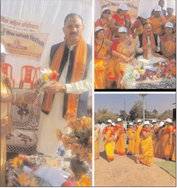
कार्यक्रम की शुरुआत समिति के सदस्यों द्वारा भारत माता के छायाचित्र पर पुष्पांजलि व आरती कर तथा राष्ट्रगान के साथ की गई। इसके पश्चात