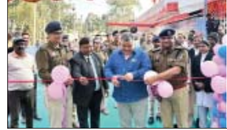
दी गई है। स्थानीय नागरिकों ने इस पहल की सराहना करते हुए इसे समाज में जागरूकता और सुरक्षा भावना को बढ़ावा देने वाला कदम बताया। यह प्रदर्शनी अगले सप्ताह तक आम जनता के लिए खुली रहेगी, जिससे सभी वर्ग के लोग नई कानूनी व्यवस्थाओं को समझ सकें और इसका लाभ ले सकें। आम जनता प्रदर्शनी के माध्यम से प्रदेश में कानून व्यवस्था और न्याय व्यवस्था के नवोन्मेष को झलक पा सकती है, जिससे आने वाले समय में सामाजिक स्थिरता और सुरक्षा को एक नया आयाम मिलेगा।