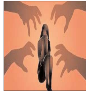
पर केस दर्ज किया गया। जानिए क्या है पूरा मामला? दरअसल, 7 सितंबर 2025 को 25 साल की विवाहिता अपनी भतीजी (14) के साथ लकड़ी लेने जंगल गई थी। इस दौरान