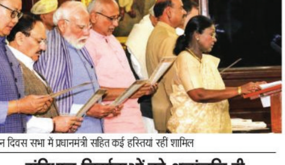
संविधान दिवस सभा में प्रधानमंत्री सहित कई हस्तियां रही शामिल

नागरिकों से अपने संवैधानिक कर्तव्यों का पालन करने की अपील की