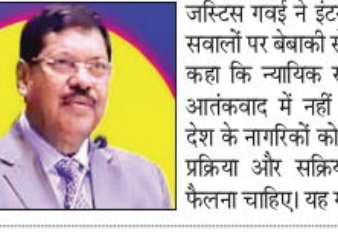
कमी भी एग्जीक्यूटिव या पॉलिटिकल नेताओं का

सेवानिवृत्ति न्यायाधीश जस्टिस बीआर गवई ने बुधवार को एक इंटरव्यू में कई अहम सवालों पर बेबाकी से बात की। उन्होंने कहा कि न्यायिक सक्रियता न्यायिक आतंकवाद में नहीं बदलनी चाहिए। देश के नागरिकों को देश की न्यायिक प्रक्रिया और सक्रियता से डर नहीं फैलना चाहिए। यह गलत है।