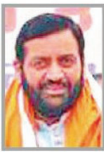
प्रेरणा नायब सिंह सैनी

हिंदुस्तान गुरुओं, संतों, महापुरुषों, फकीरों का देश है। प्रदेश में कुरुक्षेत्र की धरती पर अधर्म के विरुद्ध धर्म की रक्षा के लिए महाभारत का युद्ध हुआ। महाराज कुरु ने स्वर्ण मंडित हल चलाया एवं भगवान श्री कृष्ण जी ने अर्जुन को गीता का उपदेश दिया। इसीलिए हरियाणा सरकार ने श्री गुरु तेग बहादुर जी का 350 वां शहादत समारोह ज्योतिसर में मनाने का फैसला लिया। सरकार ने संत-महापुरुष सम्मान एवं विचार प्रसार योजना शुरू की, जिसके अंतर्गत श्री गुरु तेग बहादुर जी, श्री गुरु गोविन्द सिंह जी, बाबा बंदासिंह बहादुर जी, धन्ना भगत जी, संत कबीर जी, संत नामदेव जी और संत रविदास जी सहित अन्य महान संतों के विचारों के प्रचार-प्रसार के लिए कार्यक्रम किए जाते हैं।