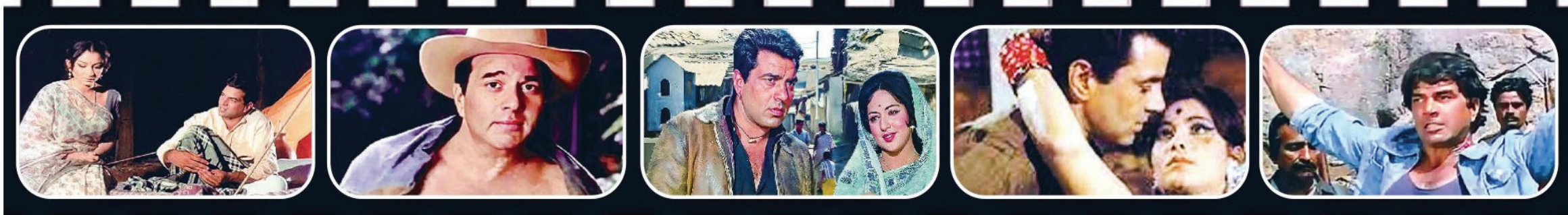
सत्यकाम:1969, गंभीर मुद्रा में भी माहिर फूल और पत्थर: 1966, इसी फिल्म से बने थे ही-मैन सीता और गीता: 1972, जैसी भूमिका वैसे एक्शन मेरा गांव मेरा देश:1971, सुपर हिट, धर्मेन्द्र को सराहा गया शोले: 1975, बसंती इन कुत्तों के सामने मत नाचना- हिट डायरॉग