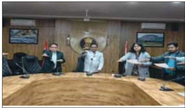
राष्ट्र की एकता और अखंडता को सुरक्षित रखने ली गई शपथ