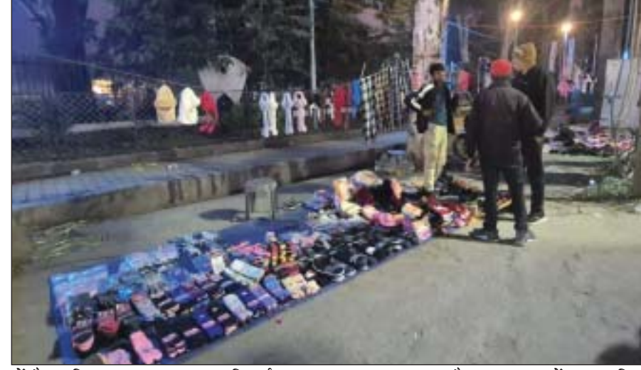
दौरान नवम्बर में 20 तारिख तक के न्यूनतम के सभी

पश्चिमोत्तरी शुष्क हवाओं का आने का क्रम जारी दिन में तेज धूप निकलने के बावजूद लोगों को ठंड से राहत नहीं है। लोग दिन में भी गर्म कपड़ों में नजर आ रहे हैं। मौसम वैज्ञानिक का मानना है कि अभी ठंड से राहत मिलने की उम्मीद नहीं है। क्योंकि पश्चिमोत्तरी शुष्क हवाओं का आने का क्रम जारी है। न्यूनतम तापमान में और गिरावट दर्ज की जा सकती है।