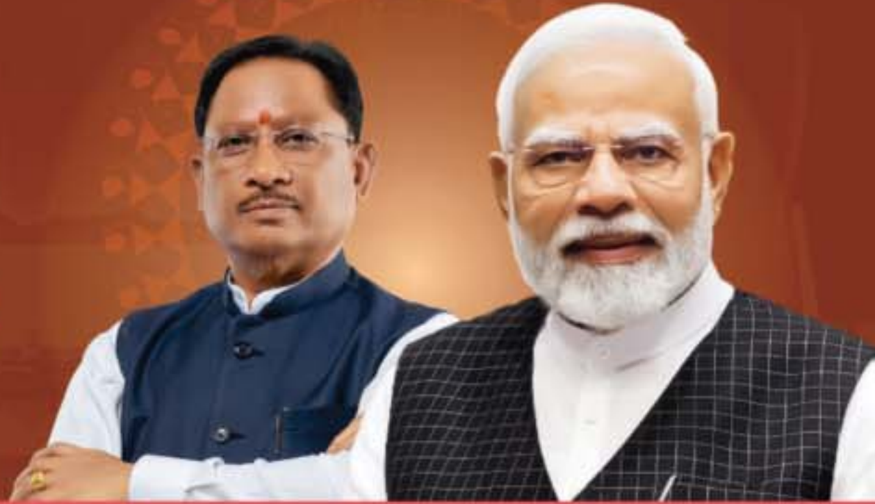
श्री विष्णु देव साय मान. मुख्यमंत्री छत्तीसगढ़

5 नवंबर 2025 | सायं 4 बजे राज्योत्सव मैदान, नवा रायपुर अटल नगर