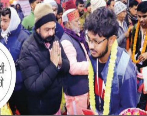
काशी तमिल संगमम में हिस्सा लेने छात्रों का पहला समूह काशी पहुंचा

पीएम नरेंद्र मोदी के संसदीय क्षेत्र वाराणसी के हिंदी भाषी स्कूली छात्र तमिल भाषा सीखेंगे। दो दिसंबर से तमिलनाडु के 50 शिक्षक और विद्वान स्थानीय स्कूलों के बच्चों को तमिल भाषा में अपनी संस्कृति, खानपान, भारत की दो प्राचीन परंपराओं (काशी-तमिल) से रूबरू करवाएंगे। इसका मकसद, छात्रों में सांस्कृतिक जुड़ाव और सभी भाषाओं का सम्मान समेत तमिल में आम बोलचाल सीखाना है। यह केंद्रीय शिक्षा मंत्रालय और आईआईटी मद्रास की पहल है।