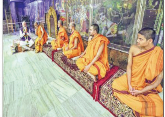
संत- मुनियों से बात करते और उनका आशीर्वाद लेते प्रधानमंत्री मोदी

पीएम ने कहा कि हमारे समाज में मंत्रों, गीता के श्लोकों का पाठ शताब्दियों से हो रहा है पर जब एक लाख कंठ एक स्वर में इन श्लोकों का ऐसा उच्चारण करते हैं... तो ऐसी ऊर्जा निकलती है जो हमारे मन, मस्तिष्क को एक नया स्पंदन, नई शक्ति देती है। यही ऊर्जा अध्यात्म की शक्ति भी है, सामाजिक एकता की शक्ति है।