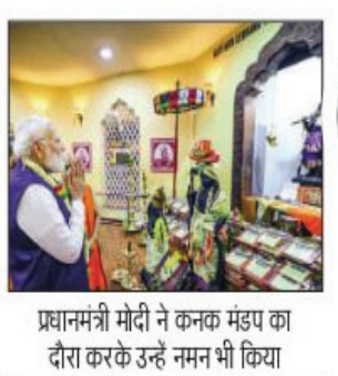
प्रधानमंत्री मोदी ने कनक मंडप का दौरा करके उन्हें नमन भी किया

उडुपी जनसंघ और भाजपा के सुदूरतन जॉइंट वी कर्मक्रम