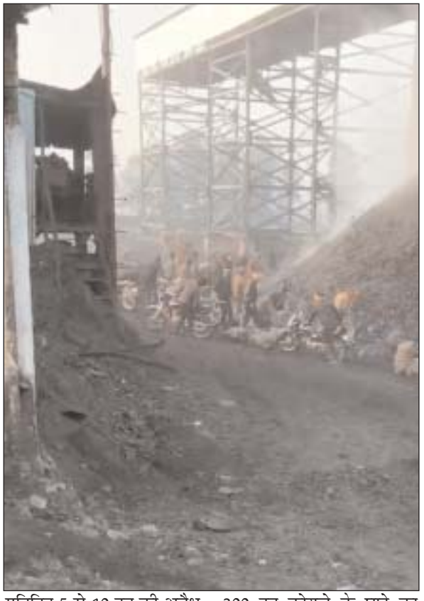
प्रतिदिन 5 से 10 टन की अवैध 300 टन कोयले के घाटे का निकासी और महीने में 150 से अंदाजा लगाया जा रहा है। यह

छ.ग.फ्रंटलाइन विश्रामपुर। एसईसीएल विश्रामपुर क्षेत्र की गायत्री खदान इन दिनों कोयला चोरों के लिए मानो खुला दरवाजा बन चुकी है। दिनदहाड़े जारी कोयला चोरी ने न सिर्फ प्रबंधन की नाक में दम कर दिया है, बल्कि सरकारी राजस्व को भी करोड़ों का चूना लग रहा है। हैरानी की बात यह है कि सुरक्षा के लिए जवानों की तैनाती के बावजूद चोरी का सिलसिला थमने का नाम नहीं ले रहा है। बताया जा रहा है कि कोयला चोरी का पूरा नेटवर्क बेहद संगठित तरीके से काम कर रहा है। खदान के अलग-अलग हिस्सों से छोटे-छोटे गैंग मोटरसाइकिल और मिनी वाहनों के जरिए कोयला निकालते हैं। कुछ मामलों में तो खदान के किनारों पर बने अस्थायी रास्तों का उपयोग कर रात के अंधेरे में बड़े वाहन भी मौके से पार करा दिए जाते हैं। सूत्रों का कहना है कि यहां से