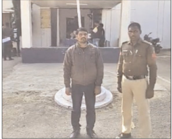
बच्चों की अश्लील फोटो, आरोपियों पर कड़ी कार्रवाई वीडियो अपलोड करने वाले की जा रही है। इसी क्रम में