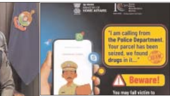
एपीके फाइल की लिंक के जरिए साइबर फ्रॉड

साइबर ठगों द्वारा पीड़ित को वीडियो कॉल या व्हाट्सएप कॉल करके कुछ खास प्रक्रिया से गुजरने के लिए बाध्य किया जाता है। वीडियो कॉल के दौरान आसपास के जगह को पुलिस स्टेशन या किसी अन्य एजेंसी के जैसा मिलता-जुलता बनाकर लोगों के मन में डर पैदा करते हैं। घटनाओं की पुष्टि के लिए कई तरह की जानकारी मांगी जाती है, ऐसे फर्जी कॉल करने वाले खुद को पुलिस, नॉरकोटिक्स, साइबर सेल, इन्कमटैक्स या सीबीआई अधिकारियों की तरह पेश करते हैं। वे बकायदा किसी ऑफिस से यूनिफॉर्म में कॉल करते हैं, इसके बाद पीड़ित पर अनजान आरोप लगाकर कानूनी कार्रवाई करने की धमकी दी जाती है और दवा किया जाता है कि पछुताह होने के दौरान उसे वीडियो कॉल पर ही रहना होगा। वह किसी और से बातचीत नहीं कर सकता है, जब तक कि प्रक्रिया पूर्ण ना हो जाए। इसी दौरान मामले से बचाने के एवज में बड़ी रकम की मांग करते हुए ठगी कर ली जाती है।