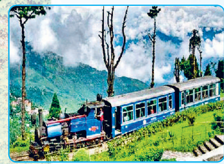
अंत में निर्मित इस रेल-मार्ग को साल 1999 में यूनेस्को ने 'वर्ल्ड हेरिटेज' यानी 'विश्व विरासत' का दर्जा दिया था। *

पश्चिम बंगाल के न्यू जलपाईगुड़ी और दार्जिलिंग के बीच चलने वाली इस ट्वॉय-ट्रेन को जर्नी तुम्हें बहुत ही एडवेंचरस ट्रेवल एक्सपीरियंस देगी। यह ट्वॉय-ट्रेन अनेक टेढ़े-मेढ़े रास्तों और पांच बड़े लूप से होकर कंचाई तक पहुंचती है। देश-विदेश के पर्यटक यहां इस ट्वॉय-ट्रेन की जर्नी को एंजॉय करने आते हैं। अठारहवीं सदी के