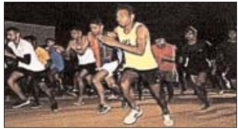
शारीरिक दक्षता सहित और अन्य भर्ती प्रक्रियाओं में भाग ले सकेंगे। रैली में भाग लेने वाले योग्य अभ्यर्थियों को प्रवेश पत्र और उनकी ई-मेल पर भेज दिया गया है। भर्ती में हिस्सा लेने के लिए एडमिट कार्ड व सभी कागज रैली अधिसूचना के अनुसार और साथ में आधार कार्ड से लिंक मोबाइल भी लेकर आना अनिवार्य है। रैली संबंधी किसी भी प्रकार की जानकारी के लिए सेना भर्ती कार्यालय रायपुर शहीद वीर नारायण सिंह अंतरराष्ट्रीय क्रिकेट स्टेडियम के पास अथवा टेलीफोन नम्बर 07712965212 पर संपर्क किया जा सकता है।

छ.ग.फ्रंटलाइन जशपुरनगर। सेना भर्ती कार्यालय रायपुर द्वारा 04 से 12 दिसंबर 2024 तक रायगढ़ स्टेडियम रायगढ़ में छत्तीसगढ़ के सभी 33 जिलों के पुरुष उम्मीदवारों के लिए अग्निवीर जनरल ड्यूटी, अग्निवीर तकनीकी, अग्निवीर ऑफिस असिस्टेंट व स्टोर कीपर व अग्निवीर ट्रेड्समैन का आयोजन किया जा रहा है। सेना द्वारा 22 अप्रैल से 03 मई 2024 तक ऑनलाइन सामान्य प्रवेश परीक्षा (सीईई) का आयोजन किया गया था। ऑनलाइन परीक्षा में उत्तीर्ण उम्मीदवार