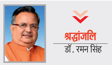
श्रद्धांजलि डॉ. रमन सिंह