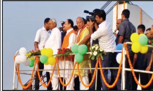
सीएम नीतीश संग किया घाटों का दौरा