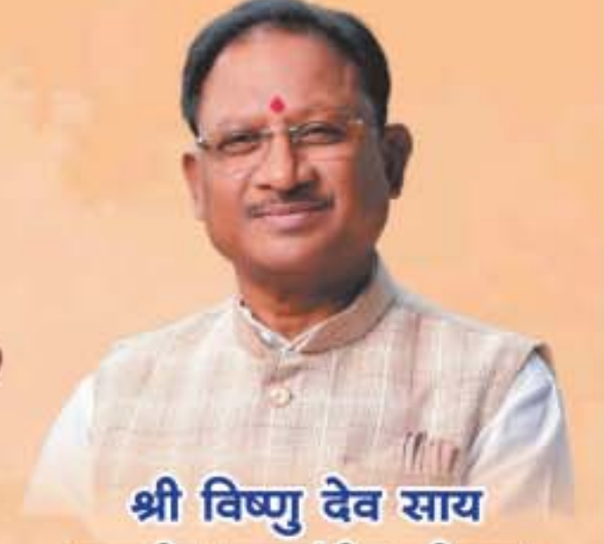
श्री विष्णु देव साय माननीय मुख्यमंत्री, छत्तीसगढ़