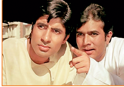
फिल्म 'आनंद' में राजेश खन्ना के साथ अमिताभ

इन दिनों ब्लाक बस्टर फिल्म 'कल्क 2898 एडी' में अमिताभ बच्चन के अभिनय की हर तरफ जमकर तारीफ हो रही है। सचमुच, अमिताभ बच्चन महज अभिनेता नहीं, अभिनय के महाविद्यालय हैं। विशेषकर उम्र के इस तीसरे पड़ाव में जब ज्यादातर अभिनेता रिटायर होकर घर बैठ जाते हैं, उस उम्र में अमिताभ नई उम्र के कलाकारों के साथ अभिनय की नई-नई उंचाइयां छू रहे हैं, एक्टिंग की ऐसी चकाचौंध बिखेर रहे हैं कि जिसे देख हर कोई हतप्रभ है। शुरुआत में ही दिख गई थी प्रतिभा: अपने करियर के शुरुआती वर्ष 1971 में आई फिल्म 'आनंद' और 1973 में आई फिल्म 'जंजीर' में ही अमिताभ ने साबित कर दिया था कि वह अभिनय के ज्वालामुखी हैं, जरा भी अनुकूल मौका मिलने पर अपनी प्रतिभा दिखा देंगे। लेकिन 'जंजीर' का विजय खना और 'आनंद' के डॉ. भास्कर बनर्जी अपने अभिनय की प्रतिभा का जलवा बिखेर पाते, इसके पहले ही उन्हें उस समय की इंडस्ट्री के फार्मूला फिल्मकारों ने हाइजेक कर लिया और एक दशक से ज्यादा समय तक उनकी सारी अभिनय प्रतिभा को एक्शन वाली फिल्मों में निचोड़ते रहे। हालांकि उस दौरान भी 'शोले', 'अमर-अकबर-एंथोनी', 'चुपके-चुपके', 'शक्ति', 'सिलसिला' और