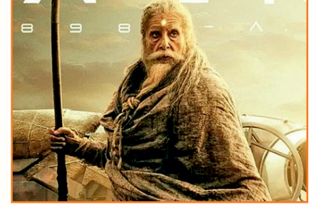
फिल्म 'कल्क' में दमदार भूमिका में दिखे बिग बी

'अनिपथ' जैसी फिल्मों में रह-रहकर उनकी अभिनय प्रतिभा दिख ही जाती थी। इन फिल्मों में दिखाया लाजवाब टैलेंट: अपनी उम्र के इस पड़ाव में लगता है जैसे अभिनय के इस शहंशाह ने खुद को एक्टिंग की भट्टी में झोंक दिया है। चाहे जितना जटिल और चाहे जितना अटपटा किरदार रहा हो, अमिताभ उसे यादगार बनाने में सक्षम हैं। वह उसमें जान फूंक देने में कोई कसर नहीं छोड़ते हैं। आर. बालकी को