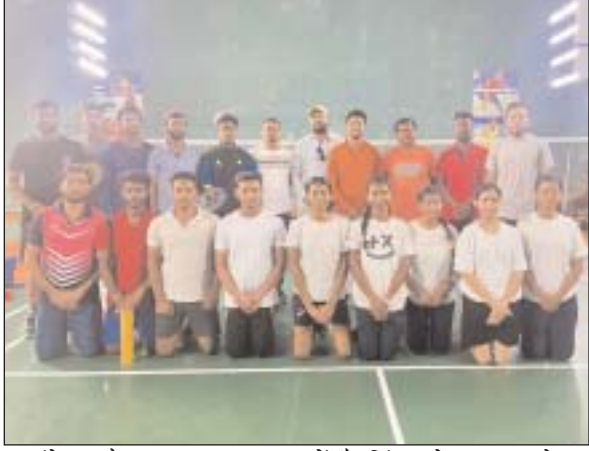
आएंगे। इनके द्वारा 14 अक्टूबर को गांधी स्टेडियम के इनडोर

छ.ग.फ्रंटलाइन अम्बिकापुर। छत्तीसगढ़ स्वामी विवेकानंद टेक्निकल यूनिवर्सिटी ने इस वर्ष से सरगुजा संभाग को नए जोन-5 के रूप में स्थापित किया है। इस जोन के अंतर्गत आने वाले तकनीकी संस्थाओं में विश्वविद्यालय इंजीनियरिंग कॉलेज अम्बिकापुर, पॉलिटेक्निक कॉलेज सूरजपुर, शासकीय पॉलिटेक्निक कॉलेज कोरिया, शासकीय पॉलिटेक्निक कॉलेज रामानुजगंज बलरामपुर, फार्मसी कॉलेज, पुणेन्द्र कॉलेज ऑफ नर्सिंग, आरपीसी कॉलेज