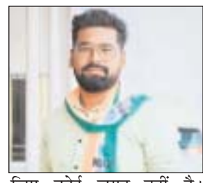
लिए कोई जगह नहीं है।

समस्त कार्यकारिणी को भंग करने हेतु पत्र लिखा है। पत्र में लिखा है कि कोई भी संगठन जनता के हित में कार्य करने एंव लोगों के साथ खड़े रहने एंव समाज में अराजकता को दूर करने के लिए होता है। एनएसयूआई में अपराध के