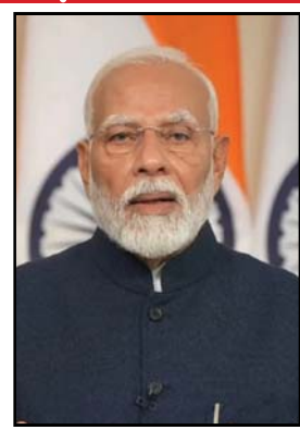
कौशल को नया पैमाना मिलेगा। यह

मोदी ने कहा कि पिछले 10 वर्षों में 25 करोड़ लोग गरीबी से बाहर निकले हैं। ये जो नव मध्यम वर्ग बना है, ये बजट उनके सर्वाधिकारण की निरंतरता का बजट है। ये नौजवानों को अनगिनत नए अवसर देने वाला बजट है। उन्होंने कहा कि यह दूरदर्शी बजट हमारे समाज के हर वर्ग का उत्थान और सर्वाधिकारण करेगा, जिससे सभी के लिए उज्ज्वल भविष्य का मार्ग प्रशस्त होगा। उन्होंने कहा कि पिछले 10 साल में 25 करोड़ लोग गरीबी से बाहर आये हैं। यह बजट नये मध्यम