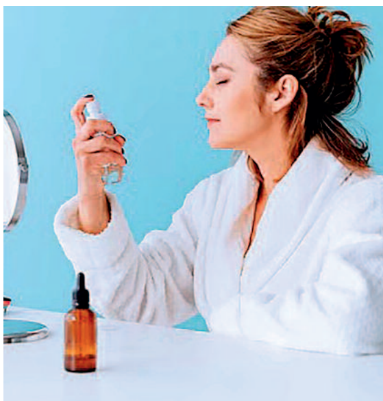
शीट मास्क देगा राहत

चेहरे पर अगर आप फेशियल ऑयल का इस्तेमाल करेंगे, तो ये हानिकारक तत्वों को चेहरे के पोर्स में जाने से रोकेगा।