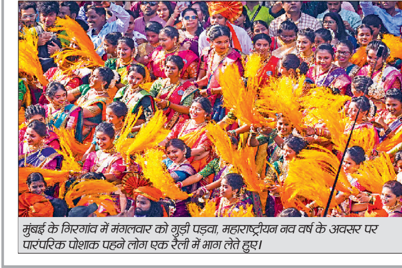
मुंबई के गिरगांव में मंगलवार को गूड़ी पड़वा, महाराष्ट्रीयन नव वर्ष के अवसर पर पारंपरिक पोशाक पहने लोग एक रैली में भाग लेते हुए।