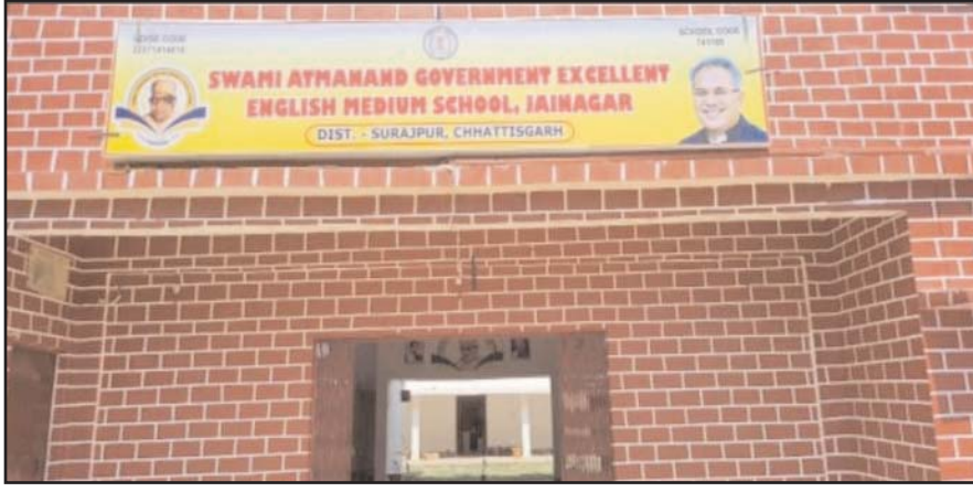
स्वामी आत्मानन्द उत्कृष्ट अंग्रेजी माध्यम स्कूल का प्रवेश द्वार।

कराया जा रहा है लेकिन मैदानी स्तर पर विभागीय उच्चाधिकारियों की उदासीनता से मुख्यमंत्री की मंशा केवल कागजों में ही पूर्णरूप से सफल