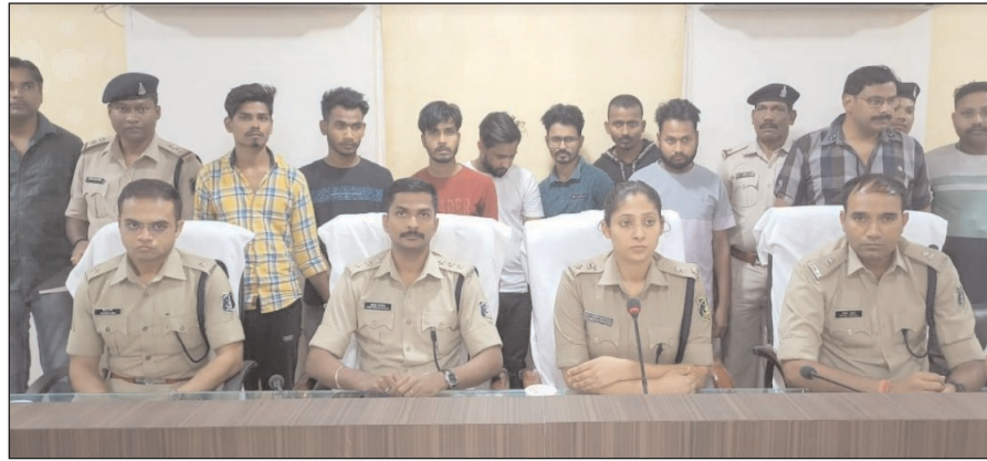
महिला द्वारा खुदकुशी का यह है मामला