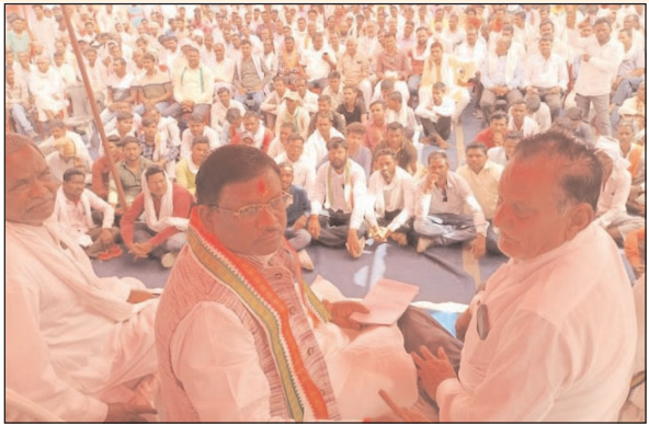
फर्जी रूप से राशि का हुआ आहरण