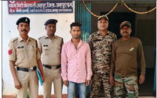
मांगने बोले, उस दौरान प्रार्थी के फोन में नेटवर्क नहीं था। तब उक्त चारों व्यक्ति उसे बोले कि दिनांक 18 अप्रैल 2022 तक अपने मालिक से 20 हजार रुपये मांगकर ला देना कहते हुये उसके पॉकेट में रखे 500/- रुपये को लूट लिये एवं डंडा से चेहरा, पीठ में मारपीट किये एवं रात्रि लगभग 01:00 बजे उसे छोड़ दिये। प्रार्थी ने अपने साथ

चौकी आरा थाना सिटी कोतवाली जशपुर में आरोपियों के विरुद्ध धारा 387, 394 भा.द.वि. का एकराध है पंजीबद्ध