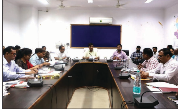
योग्यताधारी अभ्यर्थियों को सहायक शिक्षक प्राथमिक शाला के पद पर सीधी भर्ती की प्रक्रिया समय-सीमा में सम्पन्न