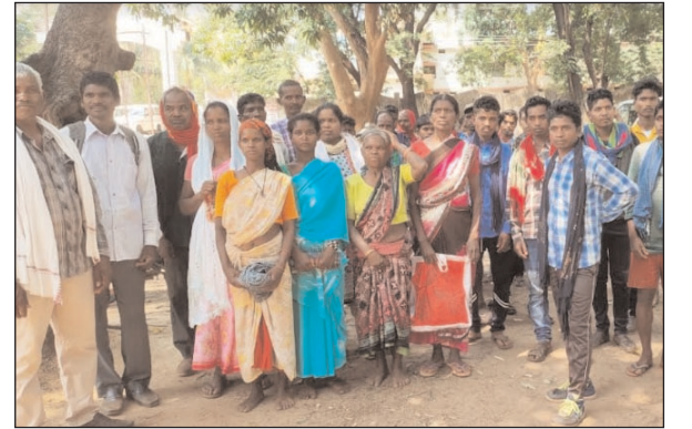
चारों पार में 150 लोगों का है बसेरा

शासनतंत्र व क्षेत्रीय विधायक के ढोल की पोल खोल रहे मैनपाट ब्लॉक के आश्रित गांव