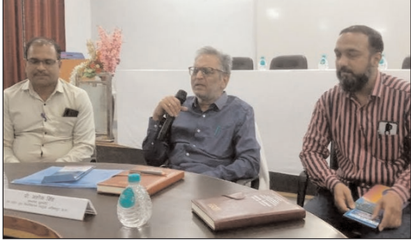
सिटी ऑफिस का होगा संचालन