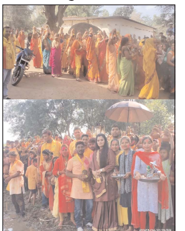
निकली भव्य विसर्जन यात्रा